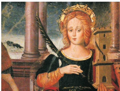
Affresco della santa nella basilica di San Benedetto, a Norcia, probabilmente perduto a causa del recente terremoto.

L'inaugurazione ufficiale della mostra vede sempre una buona affluenza di pubblico, composto di bambini, genitori e maestre;